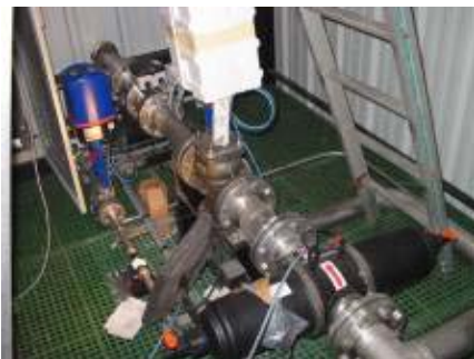
Station de rinçage pour circuit interne de sous-marin DCNS