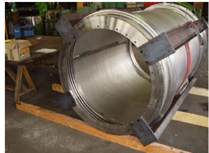
Tunnel Ligne d'arbre sous marin DCNS