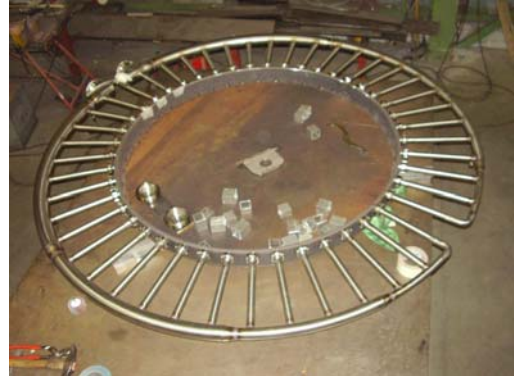
Collecteur de lavage.