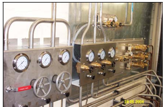
Panoplie refonte réseau Haute Pression